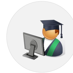
Apprentis (Interface IED)