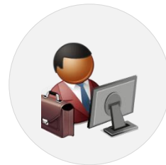
Tuteurs et Responsables de formation (Interface ITP)