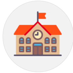
Administration et Scolarité (Interface IAS)

Tous les acteurs de l'apprentissage peuvent accéder à l'application via des interfaces dédiées.