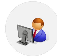
Structures Partenaires (Interface ISP)