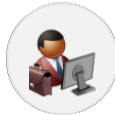
Tuteurs et Responsables de formation (Interface ITP)