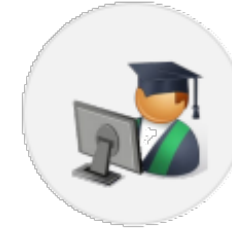
Apprentis (Interface IED)