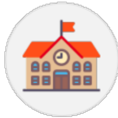
Administration et Scolarité (Interface IAS)

Tous les acteurs de l'apprentissage peuvent accéder à l'application via des interfaces dédiées.