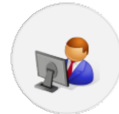
Structures Partenaires (Interface ISP)